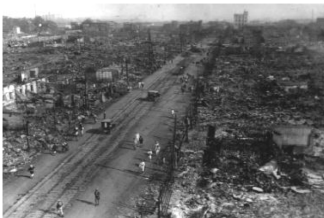
Kanto-jordskælv i 1923

I februar 1924 åbnede han en ny klinik i Nakano uden for Tokyo. Dr. Usui modtog en belønning fra kejseren for sin indsats under jordskælv, og hans ry spredtes ud over Japan. Mellem 1923 og 1925 begyndte Usui Sensei at undervise i en simplificeret form for Reiki. Han grundlagde Reiki-selskabet (" Usui Reiki Ryoho Gakkai "). Han døde den 9. marts 1926 i Fukuyama, Hiroshima ken 62 år gammel. 1 Hans elever fra Reiki-selskabet rejste i 1927 en mindesten i Seihoji-templet i Tokyo.