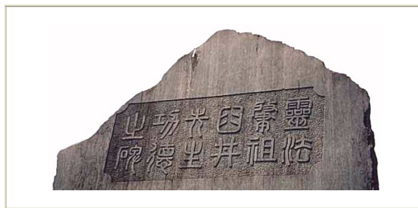
Seijohi templet med mindestenen for Usui Sensei